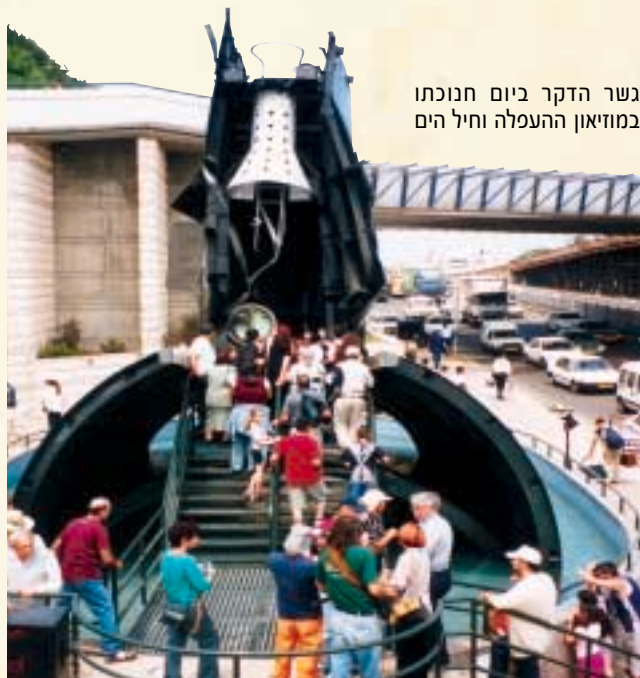
גשר הדקר ביום חנוכתו במוזיאון ההעפלה וחיל הים