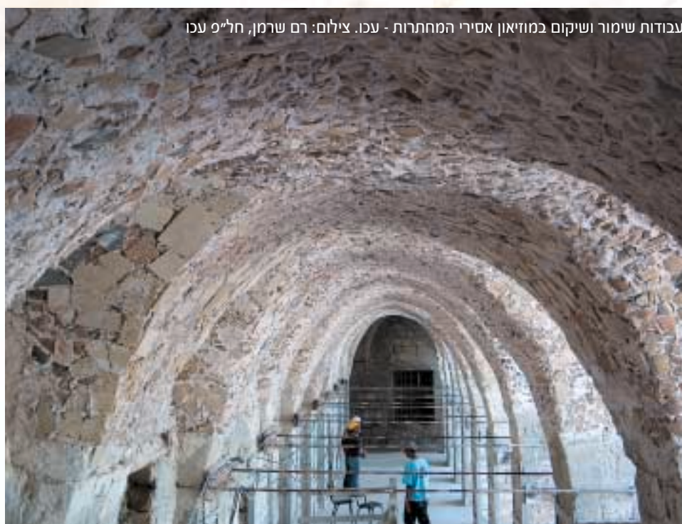
עבודות שימור ושיקום במוזיאון אסירי המחותרות - עכו.