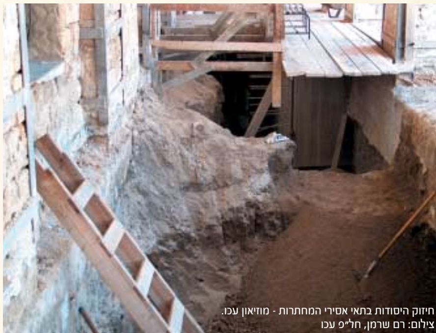
חיזוק היסודות בתאי אסירי המחתרות - מוזיאון עכו.